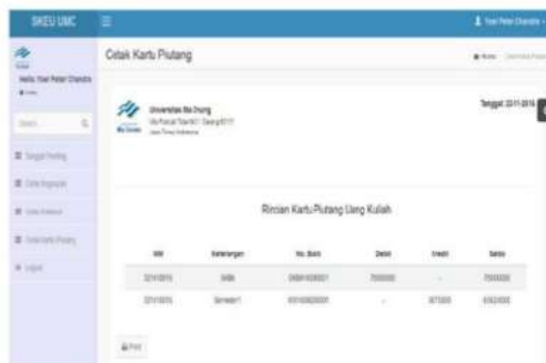
Gambar 10: Kartu Piutang

User interface Kartu Piutang berfungsi menampilkan seluruh rincian detail dari nilai total uang kuliah tunggal yang dikenakan kepada mahasiswa hingga nilai angsuran beserta dengan keseluruhan pembayaran yang telah dilunasi. Output ini juga menampilkan jumlah yang masih harus dibayar atau jumlah ta 16 nggan. Gambar 10 menjelaskan detail dari form ini.