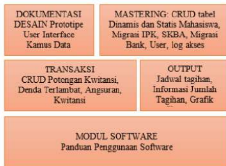
Gambar 2: Framework Penelitian

Secara rinci penelitian dapat dijelaskan menggunakan diagram framework pada gambar 2 dibawah ini.