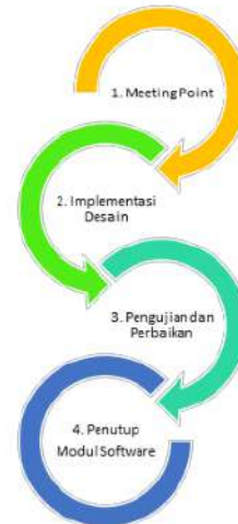
Gambar 1: Diagram Alir Metode Penelitian

Seperti tampak pada gambar 1 tentang diagram alur