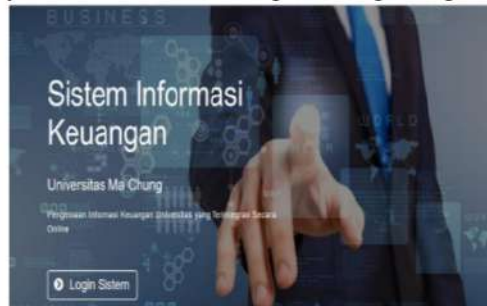
Gambar 4: Tampilan Home

User interface Home Login berfungsi sebagai media filtering hak akses pengguna sesuai dengan levelnya yaitu admin, mahasiswa, bagian keuangan, bagian