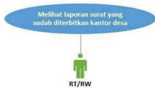
Gambar 4.4 Use Case Sistem Kepala RT/RW

Use Case Kepala RT/RW pada sistem ini hanya bisa untuk melihat rekapan laporan mengenai surat-surat yang sudah diterbitkan oleh kantor desa.