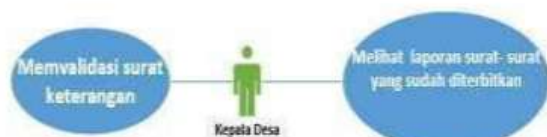
Gambar 4.3 Use Case Sistem Kepala Desa

Use Case Kepala desa pada sistem ini bisa memvalidasi surat yang sudah yang dicetak, dan bisa melihat rekapan laporan tentang surat yang sudah diterbitkan oleh kantor desa.