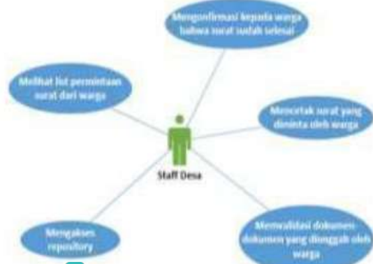
4 Gambar 4.1 Use Case Sistem Staff Desa

dibatasi sesuai dengan hak akses dari aktor tersebut. Seperti digambar dibawah ini, merupakan usecase dari Staff desa, staff desa bisa mengonfirmasi kepada warga bahwa surat sudah selesai dicetak, melihat list permintaan surat dari warga, mencetak surat yang diminta oleh warga, mengakses repository, memvalidasi dokumen-dokumen yang diunggah oleh warga.