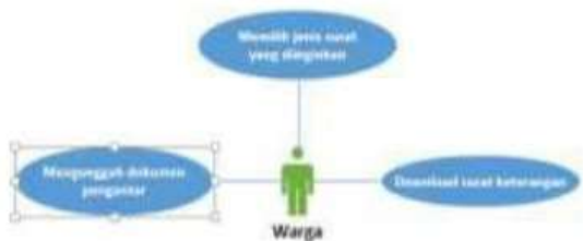
Gambar 4.2 Use Case Sistem Warga

Use Case Warga, pada sistem ini warga bisa mengunggah dokumen pengantar, download surat keterangan, memilih jenis surat yang ingin dicetak oleh warga.