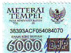
Soetam Rizky Wicaksono NIP. 20090006