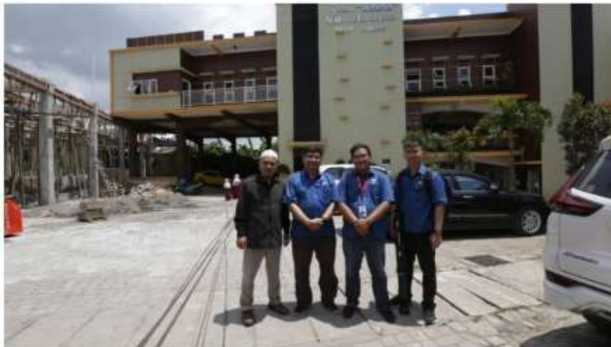
Gambar 1. Brainstorming dengan Pihak SMK