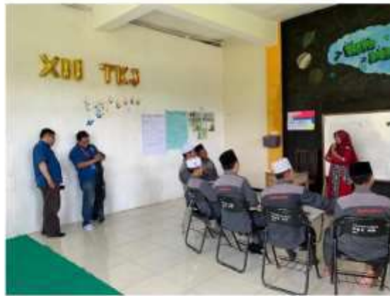
Gambar 2. Proses Shooting