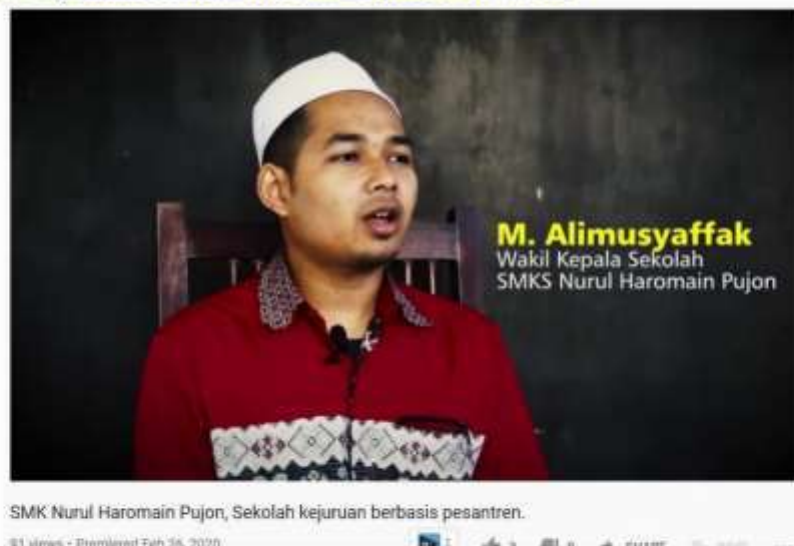
Gambar 3. Screenshot Hasil Upload