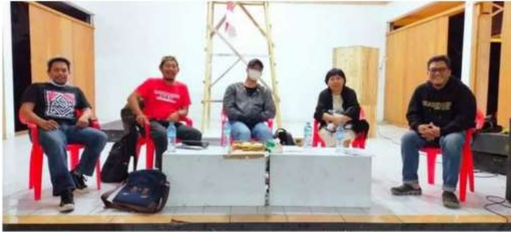
Gambar 1. Pertemuan dengan Pihak DKM

Hasil dari langkah pertama ini menghasilkan kesimpulan sementara yang digunakan untuk melakukan pembentukan diagram use case yang merupakan dari UML (Unified Modeling Language) yang sangat membantu di dalam proses perancangan dan analisis hingga ke eksekusi coding dalam aktifitas pemrograman (Petre, 2013; Rumpe, 2017). Di dalam hasil awal analisis, didapatkan diagram use case seperti pada gambar berikut.