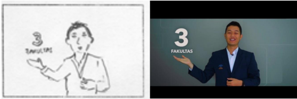
Gambar 4. Tampilan konversi desain storyboard ke desain final scene konten.

Pada gambar 4 merupakan proses editing gambar dengan menggunakan efek keying untuk menghasilkan sudut pandang baru dan menarik pada konten explainer video . Kemudian dari sisi desain visualisasi scene ini dipercantik dengan adanya caption berbasis motion graphic tentang esensi informasi yang disampaikan. Keuntungan dari pemanfaatan teknik ini adalah memberikan varian tampilan yang berbeda dan bisa membentuk persepsi positif pelanggan terhadap kualitas Universitas Ma Chung.