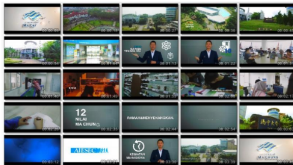
Gambar 5. Thumbnail final desain explainer videos Universitas Ma Chung.

Produk explainer video promosi Universitas Ma Chung telah selesai dan siap untuk di sebarakan ke konsumen untuk menarik minat dan meyakinkan konsumen tentang kualitas dari Universitas Ma Chung ke berbagai chanel online salah satunya adalah youtube.