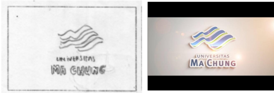
Gambar 2. Tampilan konversi desain storyboard ke desain final scene pembuka.

Pada tahap ini meliputi proses desain aset, editing video dan animasi. Hasil storyboard sebelumnya dikonversi menjadi desain final dan menganimasikannya menggunakan perangkat komputer dan software desain serta animasi. Dalam proses animation ini pihak dari Universitas Ma Chung akan dilibatkan untuk memastikan semua konsep sesuai dengan implementasinya.