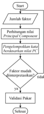
Gambar 3. Proses analisis faktor

Tahap analisis faktor dapat dilakukan secara langsung karena analisis faktor pada penelitian ini menggunakan data latih. Jumlah faktor dapat ditentukan oleh pengguna dan hasil pengelompokan ditampilkan berdasarkan jumlah faktor yang dimasukkan. Jika hasil pengelompokan masih kurang sesuai, pengguna dapat mengubah masukan jumlah faktor hingga muncul hasil yang diinginkan. Proses ini dapat dilakukan dengan bantuan pakar untuk melakukan validasi dari faktor yang terbentuk. Proses analisis faktor dapat dilihat pada gambar 3.