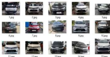
Gambar 1. Contoh gambar data latih

Pada penelitian ini data yang digunakan sebagai sumber informasi untuk CNN yang dibuat adalah citra digital dari beberapa merek mobil yang ingin dikenali. Pengumpulan data akan dilakukan dengan cara melakukan pengambilan gamba 26-obol yang tampak depan dengan memanfaatkan Google Image Search. Google Image Search merupakan salah satu search engine yang telah menerapkan penggunaan deep learning dalam proses pencariannya. Dengan menggunakan deep learning , Google Image Search dapat melakukan pencarian yang akurat, terutama pada pencarian gambar. Pencarian gambar pada Google Image Search akan dilakukan dengan menggunakan kata kunci untuk 11 jenis mobil yang akan digunakan pada penelitian ini, yaitu: Toyota Avanza, Honda Jazz, Honda Brio, Toyota Innova, Nissan Juke, Suzuki Swift, Daihatsu Xenia, Mitsubishi Pajero, Toyota Alphard, Daihatsu Grandmax, dan Toyota Yaris. Dari setiap jenis mobil tersebut akan diambil 100 buah gambar tampak depan. Setelah data gambar dari setiap merek mobil terkumpul, maka akan dilakukan pengecekan untuk menghindari adanya gambar yang sama. Data gambar yang telah terkumpul nantinya akan sebagai data latih untuk deteksi mobil serta pengenalan dari masing-masing merek mobil. Gambar 1 adalah beberapa contoh dari gambar yang didapatkan dari Google Image Search.