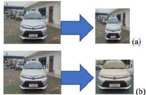
Gambar 6. Implementasi YOLO v2 pada data latih

persegi, sehingga pada saat dibutuhkan proses scaling , data latih tidak mengalami perubahan bentuk yang terlalu berlebihan (6b).