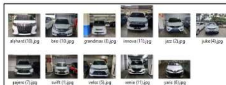
Gambar 8. Kemiripan objek yang akan diklasifikasikan

Hal lain yang dapat menyebabkan berkurangnya akurasi adalah kemiripan bentuk atau ciri khas dari setiap merek yang diujikan (Gambar 8). Secara penglihatan normal pengenalan merek kendaraan bisa jadi mudah, tetapi dalam machine learning membedakan merek kendaraan yang memiliki ciri khas yang mirip memerlukan banyak pelatihan.