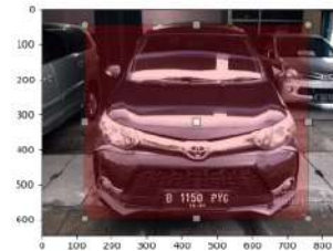
Gambar 4. Pemberian anotasi pada dataset YOLO

Untuk proses training pada metode YOLO, langkah awal yang harus dilakukan adalah memberikan anotasi pada setiap dataset yang sudah terkumpul. Pemberian anotasi yang dimaksud disini adalah memberikan kotak atau yang sering disebut sebagai bounding box pada bagian citra yang menandakan bagian dari suatu objek. Untuk contoh pemberian anotasi pada setiap dataset dapat dilihat pada Gambar 4.