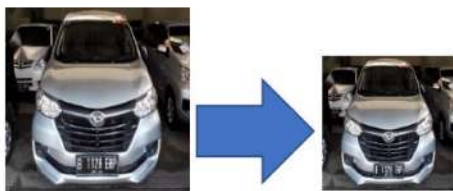
Gambar 2. Scaling pada praproses citra

Data citra digital yang terkumpul sebelum dapat digunakan sebagai data latih maupun input layer pada CNN, perlu dilakukan sebuah proses yaitu Preprocessing . Preprocessing merupakan sebuah langkah yang dilakukan dengan tujuan agar citra gambar yang digunakan sesuai dengan kebutuhan input layer dari arsitektur yang digunakan. Karena citra gambar yang didapatkan memiliki resolusi atau ukuran yang berbeda-beda, maka dalam proses preprocessing ini akan dilakukan proses scaling . Scaling merupakan sebuah proses yang dilakukan untuk mengubah ukuran dari sebuah data digital. Untuk contoh proses scaling yang dilakukan pada penelitian ini dapat dilihat pada gambar 2.