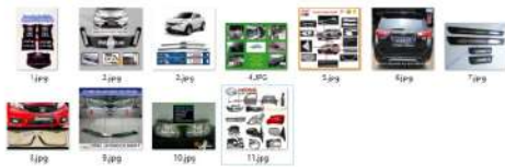
Gambar 3. Contoh gambar iklan mobil

Kemudian juga dilakukan pengumpulan data untuk contoh iklan yang akan ditampilkan sistem setelah proses klasifikasi selesai. Pengumpulan gambar iklan disesuaikan dengan merek mobil yang dapat diklasifikasi oleh sistem. Untuk contoh gambar dari iklan dapat dilihat pada gambar 3.