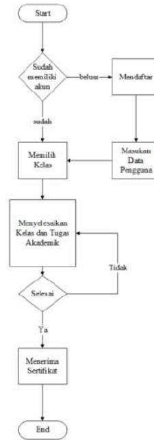
Gambar 1. Diagram alir sistem

yang dimiliki pengguna. Halaman website yang akan dibuat merupakan sebuah kelas online yang mana pengguna bisa memilih kelas mana yang akan diikuti. Pengguna yang mendaftar pada suatu kelas harus menyelesaikan rangkaian materi dan pengujian yang ada pada kelas tersebut untuk bisa mendapatkan sertifikat digital. Untuk bisa mengambil sebuah kelas, pengguna harus memiliki akun atau wallet Ethereum terlebih dahulu. Diagram alir dari sistem dapat dilihat di gambar 1.