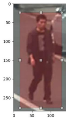
Gambar 3. Contoh Anotasi Pada Citra Training

8 Pada YOLO v2 proses training dilakukan dengan cara menerapkan jaringan syaraf tunggal pada keseluruhan citra. Jaringan ini akan membagi gambar menjadi bagian-bagian dan selanjutnya akan memprediksi kotak pembatas dan probabilitas, untuk setiap kotak bagian pembatas ditimbang probabilitasnya untuk proses klasifikasi sebagai objek atau bukan. Pada bagian akhir, akan dipilih kotak pembatas dengan nilai tertinggi untuk dijadikan sebagai pemisah objek satu dengan yang lain. YOLO v2 menggunakan arsitektur Darknet-19 yang merupakan arsitektur yang relatif sama dengan CNN lainnya yang memiliki lapisan convolutional serta 38 lapisan max-pooling . YOLO v2 menggunakan 19 lapisan convolutional dan 5 lapisan max-pooling yang diakhiri dengan lapisan softmax .