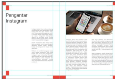
Gambar 3: Layout isi buku Instagram Post Design Guide Book

Layout daftar isi mengusung tema clean and timeless , dimana kombinasi antara huruf dan angka dibuat kontras dengan berbandingan ukuran font text sebesar 15 pt dan ukuran angka atau halaman berukuran 43 pt, komposisi warna clean dan kontras ditujukan untuk membuat pembaca lebih mudah fokus memahami letak halaman pada setiap sub judul yang tersaji didalam buku, permainan warna juga turut dipertimbangkan dimana warna paling gelap terletak pada judul utama "Daftar Isi" sedangkan warna huruf paling cerah terletak pada text sub judul, hal tersebut ditujukan untuk dapat menciptakan keseimbangan visual antara komposisi text dan huruf.