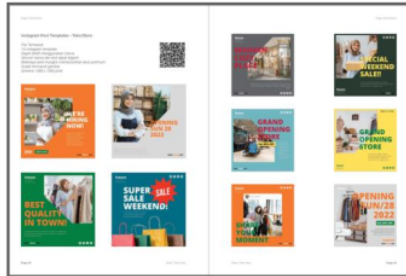
Gambar 4: Layout tampilan desain post pada buku Instagram Post Design Guide Book (Sumber: Data Penulis)

Pada bagian tampilan halaman bonus Canva template design , memuat deskripsi desain yang menjelaskan detail informasi terkait desain yang ditampilkan, selanjutnya juga tertampil QR yang dapat di scan langsung oleh para pembaca, setelah melakukan scan para pembaca akan langsung diarahkan pada halaman editing aplikasi Canva pada hand phone pengguna masing-masing, selanjutnya juga ditampilkan gambar konten secara keseluruhan untuk memudahkan para pembaca dalam mengetahui keseluruhan tampilan template yang disajikan, setelah memilih template yang paling tepat harapannya para pengguna dapat langsung menuju halaman edit dengan cara melakukan scan pada QR yang tersedia dan menyesuaikan desain dan konten sesuai dengan kebutuhan para pembaca atau pengguna.