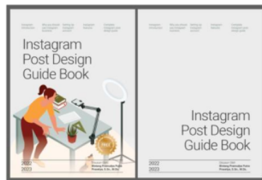
Gambar 2: Layout cover depan dan belakang buku Instagram Post Design Guide Book

Buku Instagram Post Design Guide Book memiliki dimensi lebar 17,5 x 23,7 Cm dengan material cover berjenis kertas BC Tik doff dan material isi atau bagian dalam yang berjenis korean book paper, penggunaan material BC Tik sebagai cover dan korean book paper dinilai memiliki ketersediaan yang mudah dengan harga terjangkau pada berbagai percetakan di Indonesia. Secara garis besar struktur utama layout pada buku terbagi menjadi beberapa bagian, diantaranya adalah bagian cover , bagian daftar isi, bagian utama atau isi, dan bagian display design .