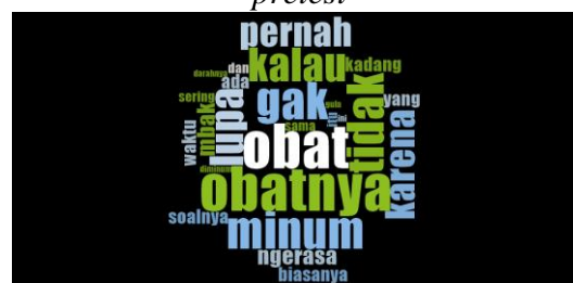
Gambar 2 Pola Ketidakpatuhan Penggunaan obat antidiabetes kelompok pasien kontrol Pretest