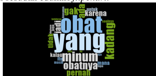
Gambar 1 Pola Ketidakpatuhan Penggunaan obat antidiabetes kelompok pasien intervensi pretest

2. Hasil pola ketidakpatuhan sebelum dan sesudah edukasi flipchart .