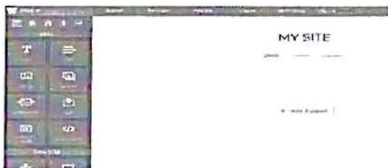
Gambar 1. Tampilan Editor Weebly

Pertimbangan lainnya adalah kemampuan weebly yang dapat melakukan pembuatan situs dengan metode drag and drop sehingga tidak lagi membutuhkan kemampuan teknis didalamnya. Termasuk didalamnya adalah kemampuan e-commerce builder yang dapat secara otomatis membuat simulasi shopping cart untuk transaksi secara online atau daring. Akibatnya, mahasiswa dapat lebih fokus terhadap simulasi pemasaran yang menjadi poin utama di dalam pengerjaan tugas. Tampilan fitur drag and drop secara lebih jelas dapat dilihat pada Gambar 1.