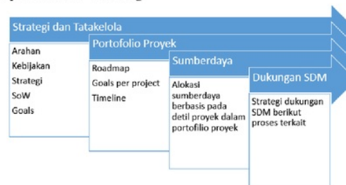
Fig. 4. Tahap persiapan pengembangan e-learning

Pada tahapan berikutnya, yakni tahapan analisis, berisi aktifitas-aktifitas yang berkaitan dengan lingkungan e-learning yang akan dibangun. Untuk UMC sendiri aktifitas-aktifitas tersebut dapat meliputi (1)Studi mengenai profil pengguna e-learning , (2)Media yang akan digunakan untuk e-learning , termasuk penggunaan media mobile device , (3) Sumberdaya e-learning , termasuk mekanisme pengisian dan pengelolaan materi yang terdapat dalam e-learning , dan (4) Pendefinisian proses bisnis dan metodologi yang digunakan dalam operasional e-learning .