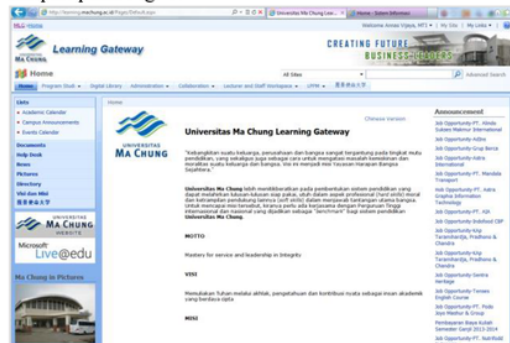
Fig. 1. Tampilan Awal Situs MLG ( http://learning.machung.ac.id/ )

Pada obyek studi yang digunakan, yakni UMC, sejak berdirinya telah menggunakan Ma Chung Learning Gateway (MLG). Ma Chung Learning Gateway (MLG) adalah situs layanan internal UMC. Sesuai namanya, bahwa situs ini pada awalnya dibangun sebagai media yang dapat menjembatani proses pembelajaran di UMC. MLG dikembangkan menggunakan kakas Microsoft Sharepoint versi 2007. Tampilan awal situs tersebut tampak pada Fig. 1.