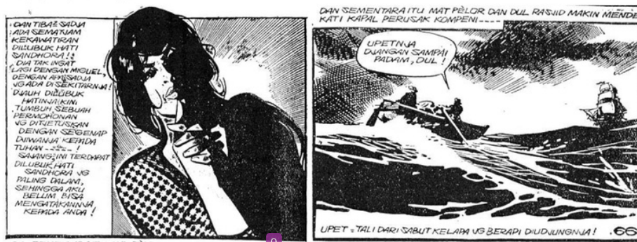
Gambar 3. Komikus memposisikan diri sebagai pelaku ketiga yang tidak terlibat secara langsung dalam keseluruhan satuan dan jalinan cerita. [Sumber : Santoso, 1970] [7]

Bertitik tolak pada narasi tekstual pada caption , Teguh Santosa memaparkan cerita dengan mengambil titik pandang narrator omniscient : pengisah yang berfungsi sebagai pelaku cerita. Teguh sebagai komikus tahu secara pasti dan cukup mendetail suasana batin dan pikiran yang dialami oleh Sandhora, melalui sebuah tuturan dalam caption pada halaman 56 : "Sebenarnya Sandhora lebih senang mendengar Mat Pelor berbicara tentang cinta, tetapi naluri kewanitaannya mengekang keinginan agar Mat Pelor berbicara soal itu! Sandhora mulai bisa menilai bagaimana Mat Pelor ini, bukannya ia seorang yang berpengetahuan rendah lebih-lebih dalam menilai masalah hidup yang seba pelik ini!".