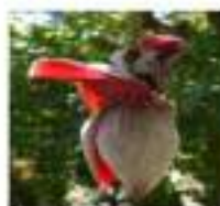
Gambar 1. Jantung Pisang Musa paradisiaca L.

Penetapan kadar abu pada dasarnya memiliki prinsip kerja dengan melakukan pengoksidasian zat organik dengan suhu tinggi dan bertujuan untuk mendeteksi adanya unsur atau senyawa mineral dan dalam air bertujuan dalam air terkandung dalam bertujuan memisahkan senyawa-senyawa mineral dari hasil didapatkan menunjukkan bahwa mencapai 66,51 % yang larut asam hanya sebesar 33,49 % dan penetapan bahan organik asing diperoleh 11,201 gram untuk zat asli dan 9,101 gram untuk bahan pengotor dengan persentase zat murni 56% dan 45% zat pengotor.