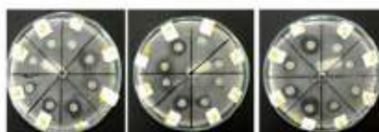
Gambar 1. Hasil uji disc diffusion fraksi terhadap bakteri E. coli

Uji aktivitas antibakteri terhadap bakteri E. coli dilakukan dengan pemberian minyak atsiri tunggal dan kombinasi (Tabel 1). Pada pemberian minyak atsiri tunggal konsentrasi 5%, masoyi memiliki zona jernih lebih besar dibandingkan dengan kayu manis yaitu 0,7 ± 0,11 cm dan 0,67 ± 0,24 cm. Sedangkan pemberian konsentrasi 10%, zona jernih kayu manis lebih besar dibanding masoyi yaitu 0,89 ± 0,24 cm dan 0,7 ± 0,02 cm. Pemberian kombinasi menunjukkan hasil zona jernih yang lebih besar dibanding pemberian tunggal. Urutan zona jernih dari diameter paling kecil yaitu kombinasi minyak atsiri masoyi 5% dan kayu manis 5%, minyak atsiri masoyi 10% dan kayu manis 5%, dan minyak atsiri masoyi 5% dan kayu manis 10% yaitu sebesar 0,82 ± 0,36 cm, 0,98 ± 0,36 cm, dan 1,06 ± 0,15 cm (Gambar 1).